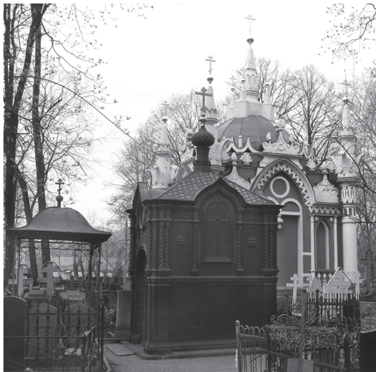
Рис. 1. Часовня Креста Господня и Никольская часовня на Преображенском кладбище (фото автора, 2007 г.)

На староверческом Преображенском кладбище блаженный Иоанн не только молился кресту, но и порою ночевал: «нощию же часто на могилахъ мертвыхъ обнощеваше лѣтнее и осеннее время» (л. 402). Здесь же он нашел и последнее упокоение (скончался 30 июля 1840 г.): «Погребень же бысть при великомъ стечении народа съ подобающею честью на Преображенскомъ кладбищѣ близъ часовни на правой сторонѣ, идѣже и крестъ надъ нимъ поставленъ каменный съ надписью его въкратцѣ жития» (л. 403 об.).