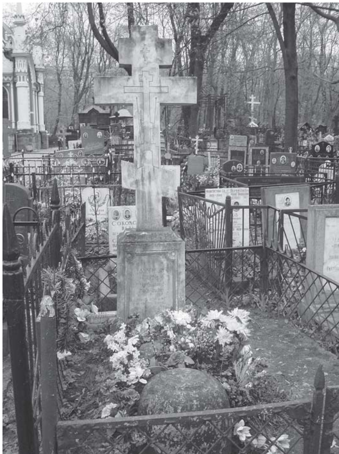
Рис. 2. Могила блаженного Иоанна Козмича на Преображенском кладбище (2007 г.)

сведениями, мы можем утверждать, что именно к этому подвижнику относятся отрывочные сведения, которые обнаруживаются в других письменных памятниках московских старообрядцев-беспоповцев.